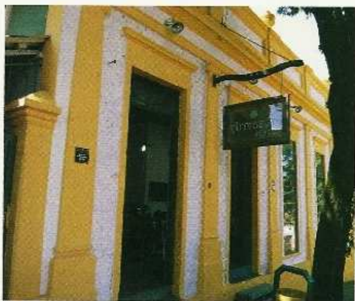
> O Armazém da Rocha vende delícias dos produtores locais