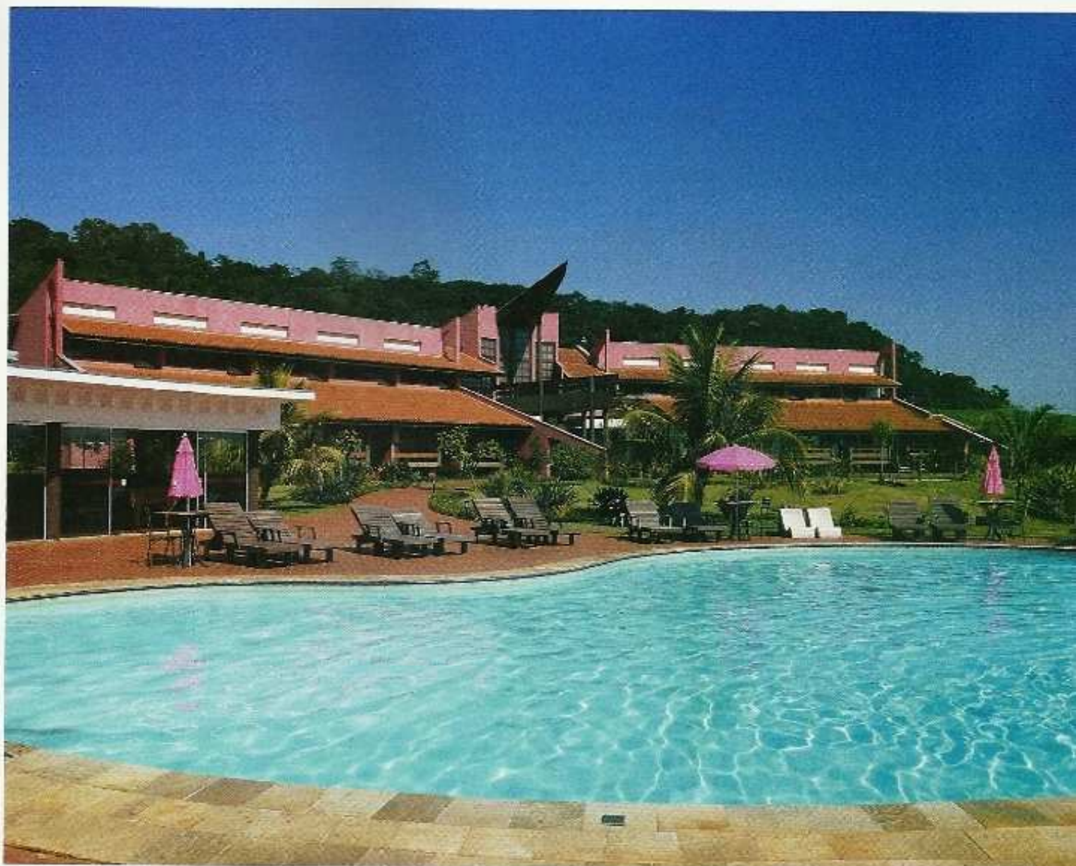
Além da grande piscina, a Frangipani tem academia, piscina aquecida, trilhas e jardins espalhados em um terreno de 150.000 m 2

> O apetite também é revigorado depois. Na cidadezinha típica de interior – com a igreja matriz na entrada, a praça e as duas ruas principais – há alguns restaurantes simples e bons, que fazem a autêntica comida caipira paulista. Recomendo o Malagueta e o Santa Gula, no miolinho urbano. À noite, os programas são dar um giro pela cidade, bebericar em algum bar curtindo a noite de céu limpo e estrelado, e dormir cedo. Para no dia seguinte encarar mais uma aventura na água ou um bom banho de cachoeira.