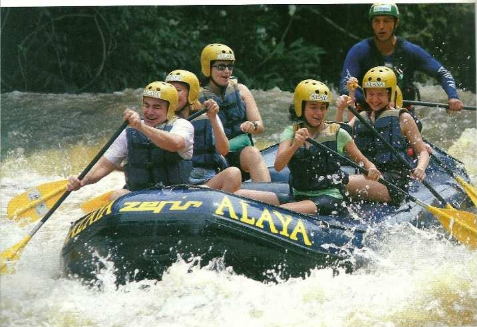
O rafting no rio Jacaré Pepira é uma das principais atrações de Brotas, e pode ser feito inclusive nas noites de lua cheia