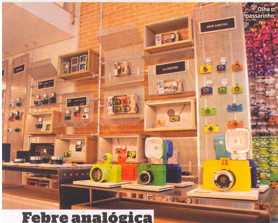
Olha o passarinho